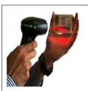
Lector Cedula Col.