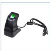
Lector Huella USB

Modulo Declaración Minera: Formulario Digital para la compra Minerales en campo(Barequeros).