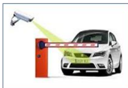
LPR reconocimiento Placas