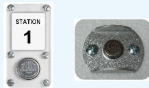
Estaciones de Registro