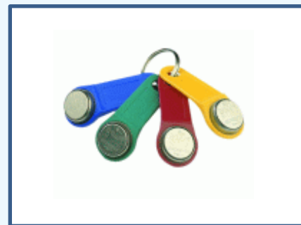
Llaveros de identificación