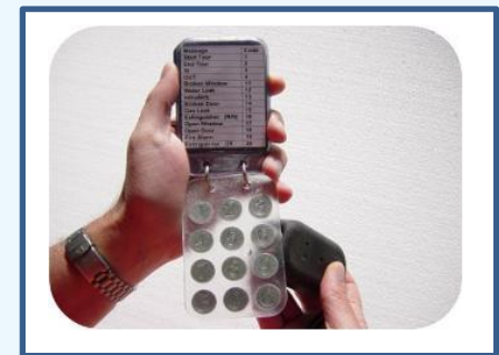
Libreta de Novedades